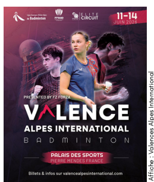
Affiche : Valence-Alpes International

Du 11 au 14 juin 2026, venez rejoindre une équipe de bénévole et participez à un tournoi international qui accueille 180 joueurs venus du monde entier.